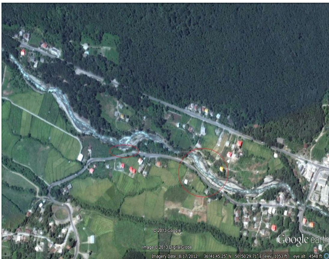
شکل ۳- وضعیت راه‌های ارتباطی که در معرض خطر مستقیم سیلاب قرار دارد (روستای گاویل)