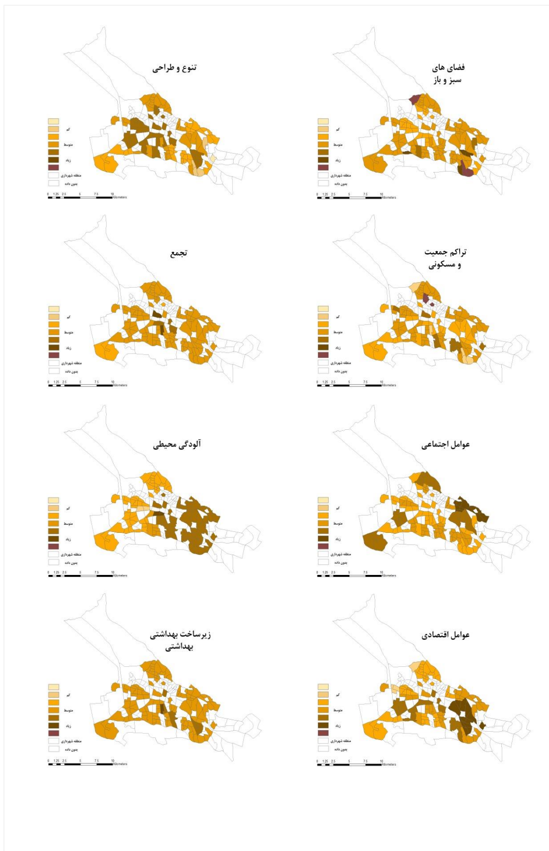
شکل ۳. توزیع فضایی مؤلفه‌های تاب‌آوری شهری در بحران اپیدمیولوژیک محلات کلان شهر تبریز