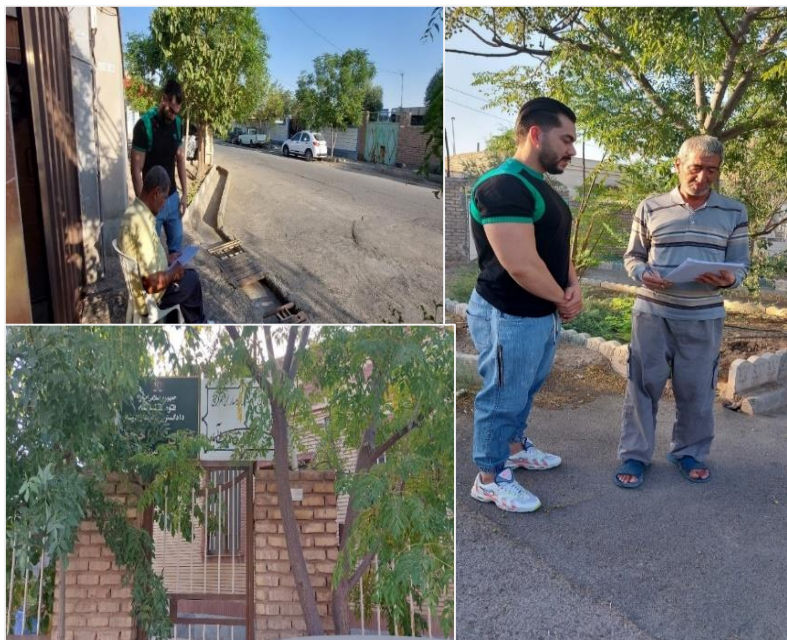
شکل ۲. نقشه منطقه مورد مطالعه

در شهرستان گرمسار روستاهای متعددی از جمله غیث آباد، شورقازی، محسن آباد، نورالدین، ریکان، قاتول، کردوان و غیره وجود دارد که در این پژوهش، تمرکز بر روستاهای غیث آباد، شورقازی و محسن آباد می‌باشد (شکل ۲)، که طرح بیابان‌زدایی دارند. این روستاها در جنوب شهر گرمسار واقع شده‌اند، طبق آخرین سرشماری، تعداد خانوار ساکن در روستای غیث آباد ۲۸۰، تعداد خانوار ساکن در روستای شور قاضی ۵۰ و تعداد خانوار ساکن در روستای محسن آباد ۱۵۰ خانواده می‌باشد. در سه روستای مذکور، عمده فعالیت افراد، پرورش گوساله و دام‌پروری، کشاورزی و سبزی‌کاری می‌باشد.